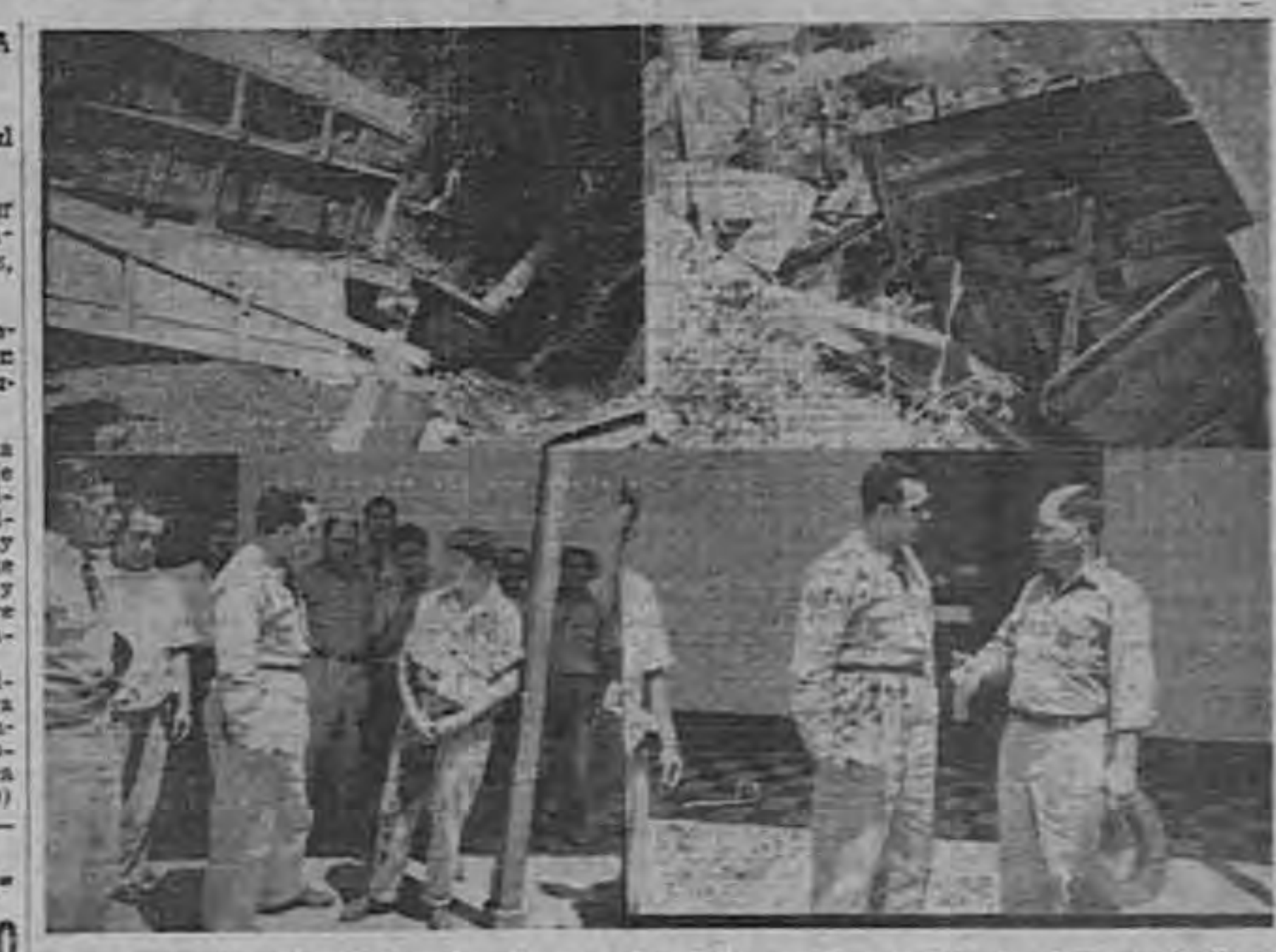
Muestran las fotos de ROA arriba, dos aspectos de la cascada destruida al ser estrellada por su chofer contra el paredón. Abajo, el Director General de Tránsito, interrogando al chofer y uno de los pasajeros que milagrosamente salieron con vida del trágico accidente de la cuesta de la Chinchilla.

Ayer, la Cuesta de la Chinchilla volvió a ser teatro de otra tragedia que conmovió a la ciudadanía cartaginesa. A la cascada placa 16826 que viajaba de Pacayas a Cartago, se le rompió un eje. (Pasa a la Pág. OCHO)